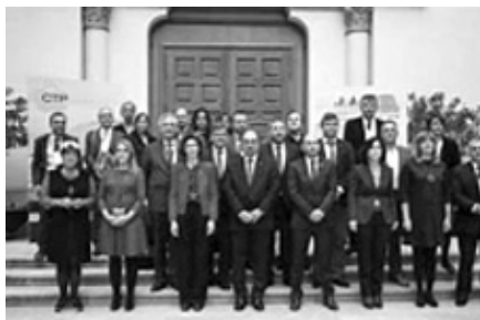
Reunió de la Comunitat de Treball dels Pirineus (CTP) a Saragossa l'any 2018, amb l'assistència de la ministra d'Afers Exteriors d'Andorra, Maria Ubach

L'activitat manufacturera principal d'Andorra des de la primera meitat del segle xvii fins a la segona meitat del segle xix fou la farga. El procés de transformació de la mena de ferro en lingots de ferro per fabricar després eines, ferradures pels cavalls, arades i altres estructures amb aquest material, exigia el coneixement d'una tècnica a l'abast només de gent especialitzada. La presència de gascons per treballar a les fargues andorranes es troba molt documentada tant a l'arxiu de la casa Areny-Plandolit com de la casa Rossell, ambdues d'Ordino.