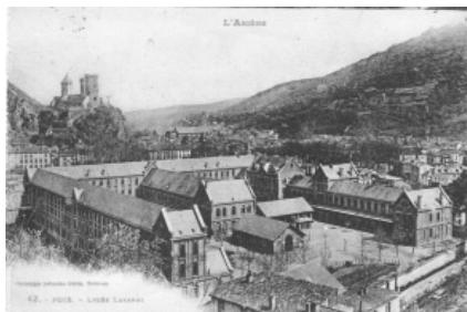
Liceu Lakanal a Foix, on alguns estudiants de les Valls d'Andorra van estudiar

exemple de la possibilitat d'executar projectes conjunts entre territoris diferents del Pirineu, ja que va tenir el suport de les autoritats del Consell General de Llenguadoc-Rosselló, del Principat d'Andorra i de Catalunya. També hi participaren diverses associacions, entre les quals l'UCE i la SAC. Aquest centre dona suport als estudiants interessats en la història dels diferents territoris de parla catalana. Una mostra més de la solidaritat entre les regions del Pirineu.