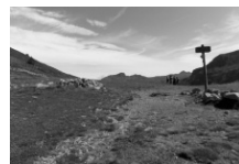
Port d'Incles o de Fontargent, límit entre les Valls d'Andorra i França, o entre la Parròquia de Canillo i la Comuna d'Aston