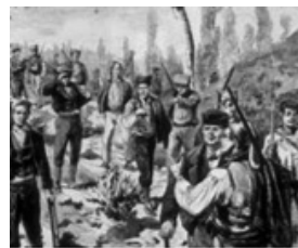
Grup de soldats carlins