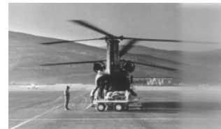
Avió militar a l'aeroport de la Seu d'Urgell durant els aiguats de l'any 1982

Alguns venien d'una situació econòmica i social molt benestant i van contribuir amb un esperit emprenedor al creixement del país en el sector privat. Altres eren persones amb una formació acadèmica que els va permetre desenvolupar la seva activitat professional liberal al nostre país. Altres, senzillament, van venir a treballar al servei d'algunes cases del país com a masovers o mossos.