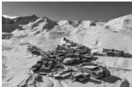
El Pas de la Casa

Avui, el creixement de l'economia andorrana, gràcies al comerç i al turisme de lleure, han convertit Andorra en un país estable en el pla financer i amb una sòlida i potent infraestructura bancària que atrau inversions de particulars i d'empreses estrangeres. L'atractiu pel dipòsit de capitals estrangers fomentats a partir d'una pressió fiscal baixa ha comportat el que avui ningú no posa en dubte, la importància d'Andorra en el mercat financer. El resultat és la conseqüència d'haver fet un esforç important cap a la transparència financera