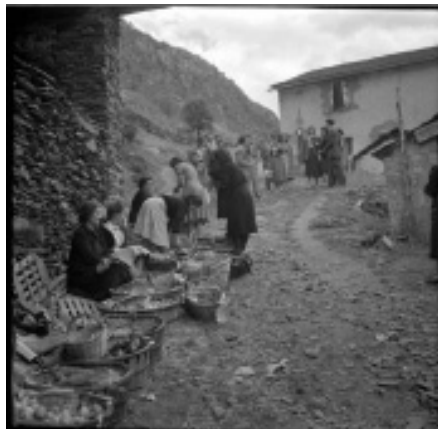
Venedores de fruita de la Seu d'Urgell durant la festa de Meritxell l'any 1949