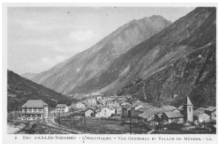
L'estació de tren, el magatzem dels andorrans i la fonda de Cal Tatina, a l'Ospitalet