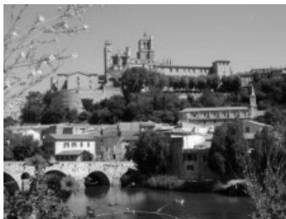
Besiers. Ciutat de referència per a molts emigrants procedents de les Valls d'Andorra entre final del segle XIX i principis del segle XX